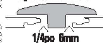
Figure 1: Moulure en «T»